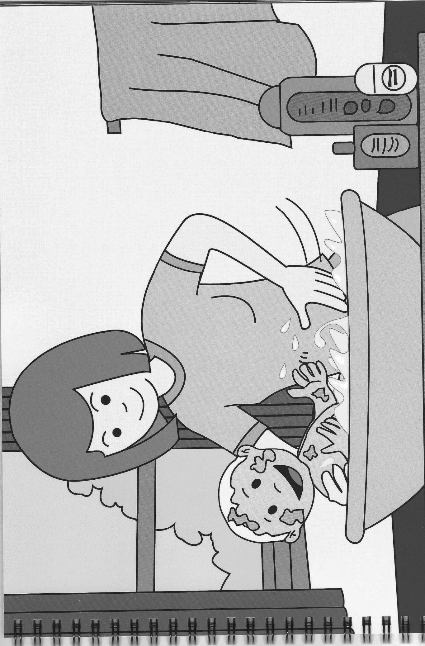
Mamá lava al bebé.