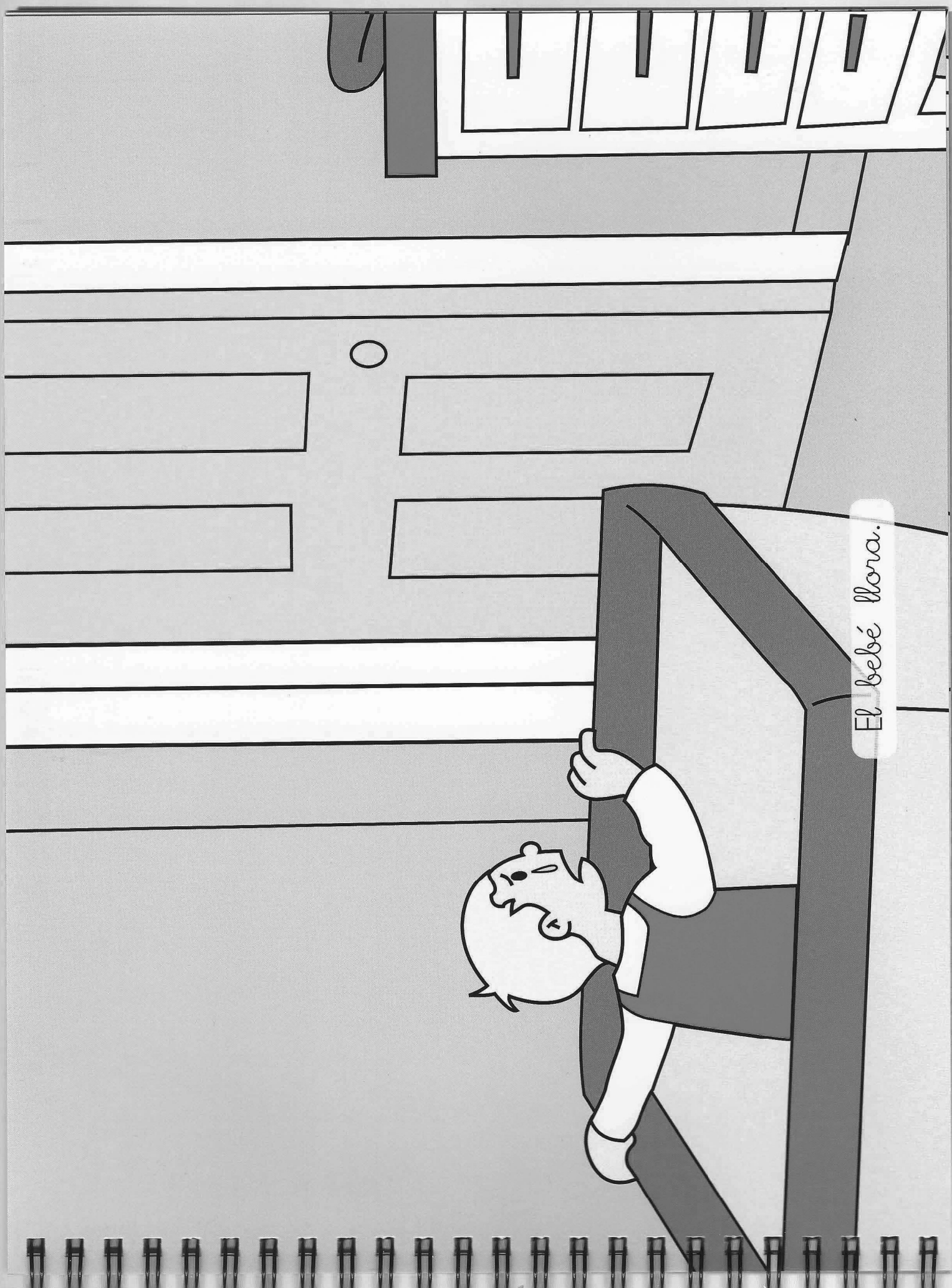
El bebé llora.